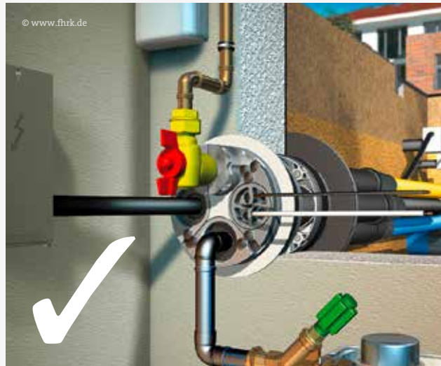
Abb. 1: Beispiel Mehrspartenhauseinführung (theoretisch)

Für Ihre Standard-Netzanschlüsse DA32 (Gas und Wasser) und 35mm 2 (Strom) muss ein nach DIN 18322 und DVGW-VP 601 zugelassenes Hauseinführungssystem eingebaut werden