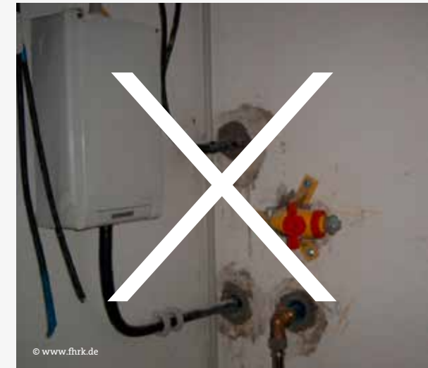
Abb. 3: Nicht gas- und wasserdichte Ausführung