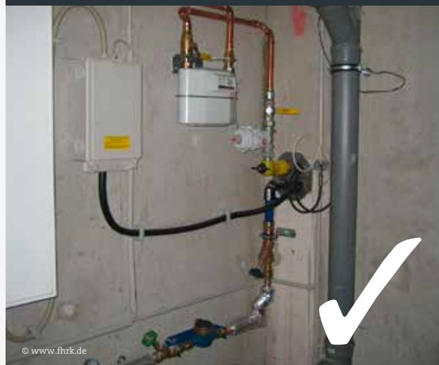
Abb. 2: Praxisbeispiel Mehrspartenhauseinführung

Für Ihre Standard-Netzanschlüsse DA32 (Gas und Wasser) und 35mm 2 (Strom) muss ein nach DIN 18322 und DVGW-VP 601 zugelassenes Hauseinführungssystem eingebaut werden