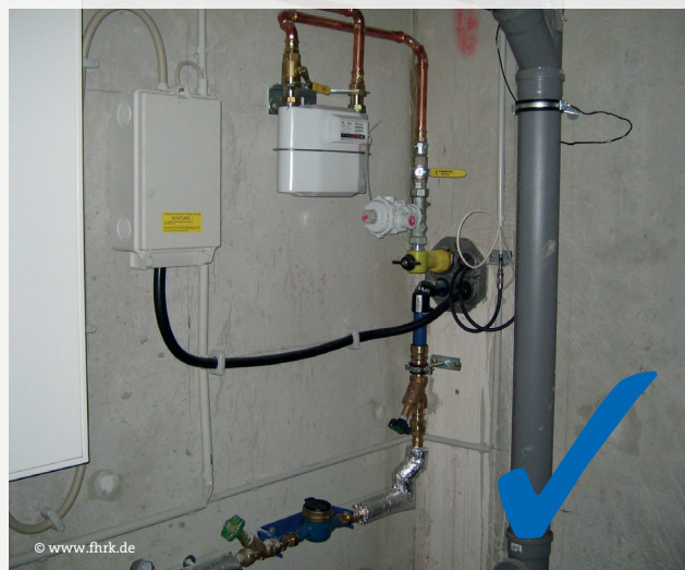
Abb. 2: Einbau Hauseinführungssystem

Für Ihre Netzanschlüsse muss entweder eine fachgerechte Einzeldurchführung der Leitungen berücksichtigt (Abb. 1) oder ein nach DIN 18322 und DVGW-VP 601 zugelassenes Hauseinführungssystem eingebaut werden (Abb. 2).