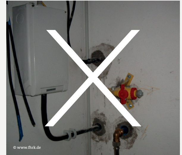
Abb. 3: Nicht gas- und wasserdichte Ausführung