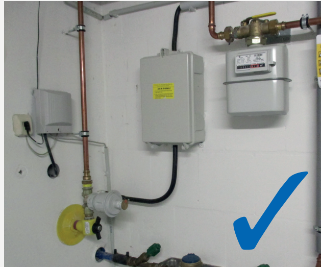
Abb. 1: Fachgerechte Einzeldurchführung

Für Ihre Netzanschlüsse muss entweder eine fachgerechte Einzeldurchführung der Leitungen berücksichtigt (Abb. 1) oder ein nach DIN 18322 und DVGW-VP 601 zugelassenes Hauseinführungssystem eingebaut werden (Abb. 2).