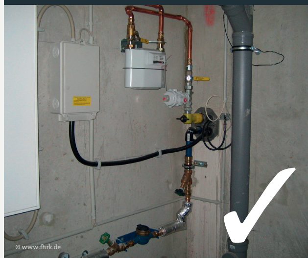
Abb. 2: Praxisbeispiel Mehrspartenhauseinführung

Für Ihre Standard-Netzanschlüsse DA32 (Gas und Wasser) und 35mm 2 (Strom) muss ein nach DIN 18322 und DVGW-VP 601 zugelassenes Hauseinführungssystem eingebaut werden